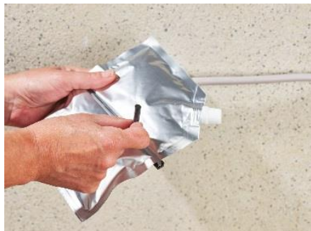
3. Vorbereiten des ISO FLEX Gel durch Herausziehen der Feuchtigkeitssperre, die den Beutel in zwei Kammern unterteilt.