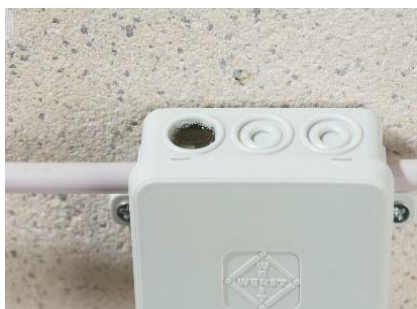
7. Kompletten Abzweigkasten mit ISO FLEX Gel befüllen. Nach ca. 50 Minuten ist das ISO FLEX Gel getrocknet und ausgehärtet