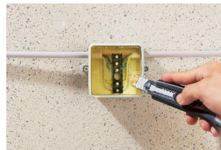
9. Bei Bedarf kann das ISO FLEX Gel wieder aus dem Abzweigkasten entfernt werden