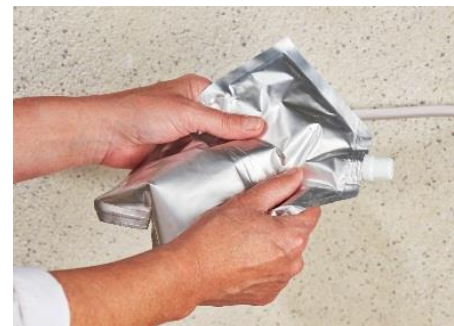
4. Mischen (ca. 3 Minuten) der zwei Komponenten durch gutes Durchkneten des geschlossenen Beutels.