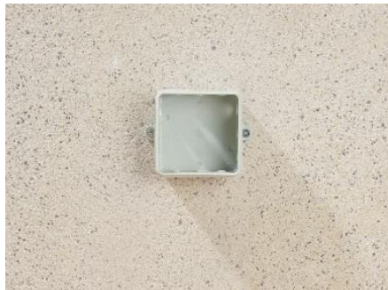
1. Montage des Abzweigkastens.