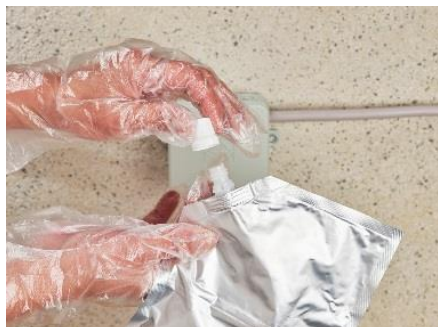
5. Handschuhe anziehen und Drehverschluss des Beutels öffnen.