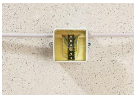
8. Die Verkabelung in dem Abzweigkasten ist nun 100% wasserdicht