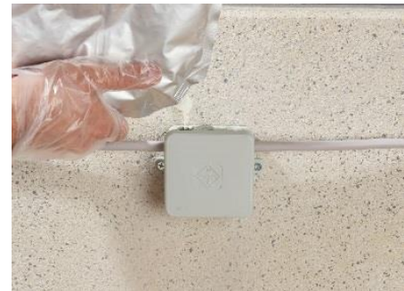
6. ISO FLEX Gel aus dem Beutel in den geschlossenen Abzweigkasten einfüllen.